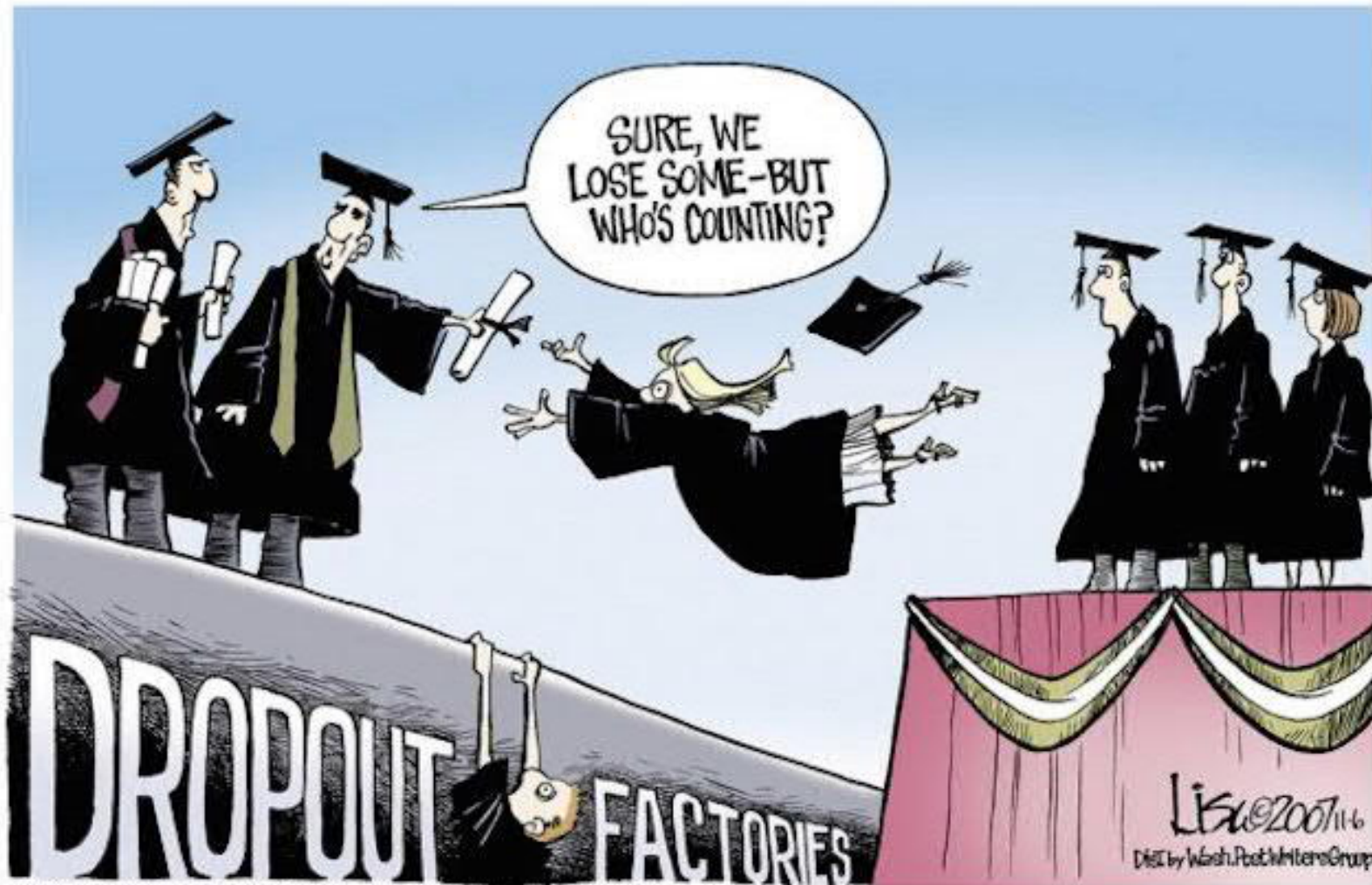
(c) 2007 Lisa Benson, Distributed by The Washington Post Writers Group. Reprinted with Permission.